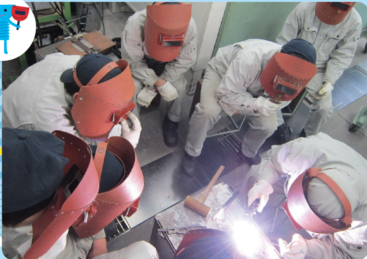
溶接見本実演風景例