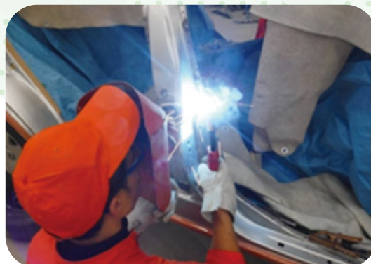
応用実習 (センターピラー 交換作業)

※その他、事故に備える訓練生災害保険や、校外見学の交通費等の自己負担が生じる場合があります。