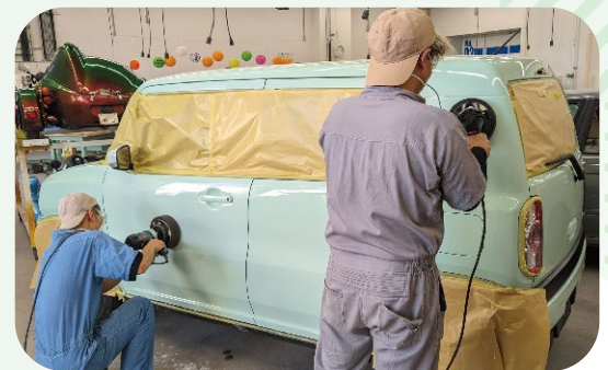
応用実習(ポリッシング作業)