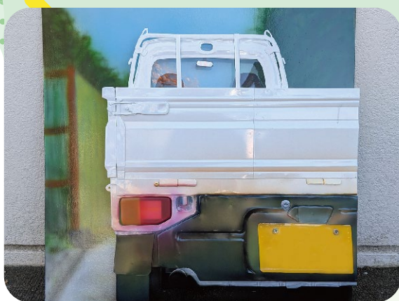
板金工作基本実習(板金レリーフ制作)