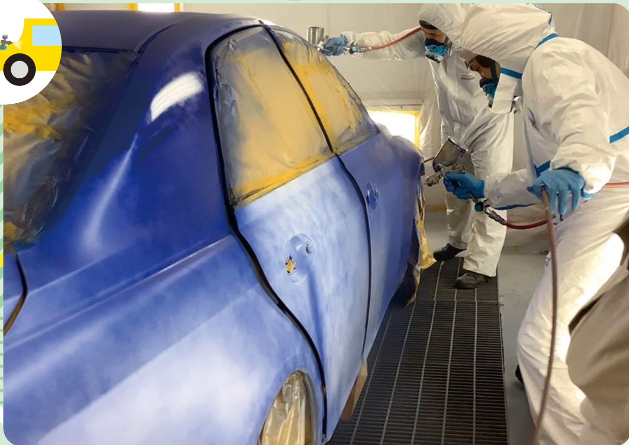
金属塗装実習(自動車オールペイント作業)