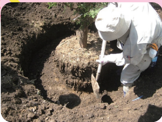
移植のための根巻作業