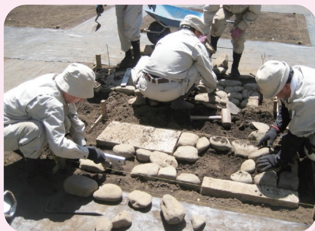
自然石を並べる延べ段作業