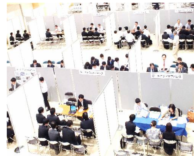
昨年度の様子です。1社1ブースをご用意します。説明会は、1回30分を5回実施し、1回あたり、説明20分、質疑応答10分です。

業種等に制限はありませんが、当センター等の職業訓練生も多数参加を予定していますので、技術職、技術営業等の採用をお考えでしたら、ぜひ説明会にご参加ください。皆様のお申込みをお待ちしております。