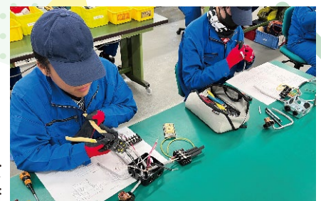
第一種電気工事士 受験対策