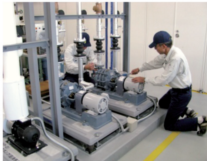
給水ポンプ据え付け実習

※その他、社会人マナー・企業見学・体育等を実施します(科目により異なります)。訓練の流れは、一例です。前後する場合があります。