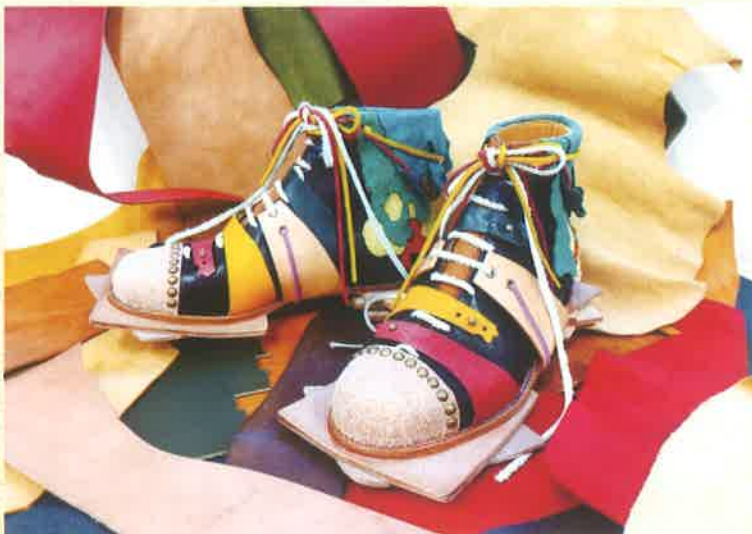
グランプリ（令和6年度生）