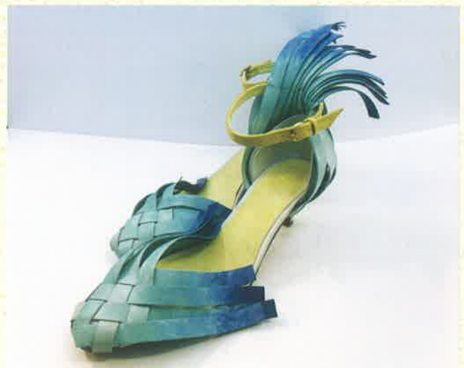
準グランプリ（令和6年度生）