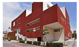
城東職業能力開発センター