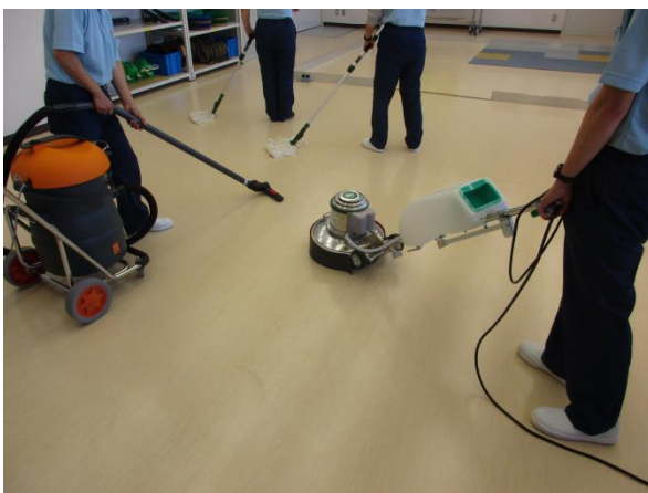
ビルクリーニング実習