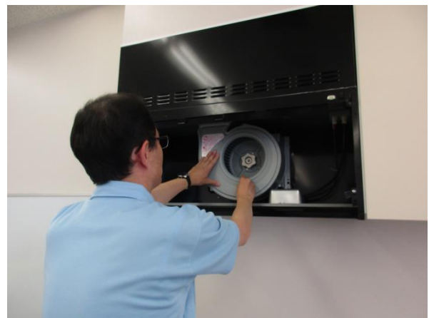
ハウスクリーニング実習