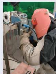
半自動アーク溶接