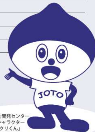
城東職業能力開発センター イメージキャラクター 「ものづくりくん」