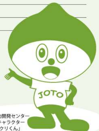
城東職業能力開発センター イメージキャラクター 「ものづくりくん」