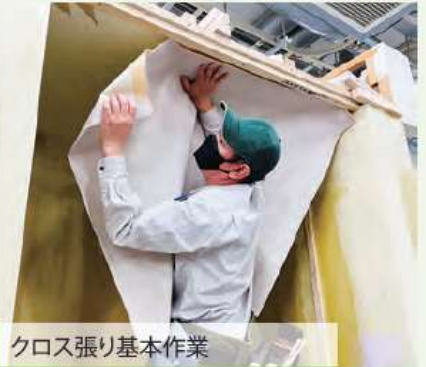
クロス張り基本作業

内装タイルを接着剤で張っています。デザインが豊富で様々なインテリアに合わせられる魅力的な材料です。