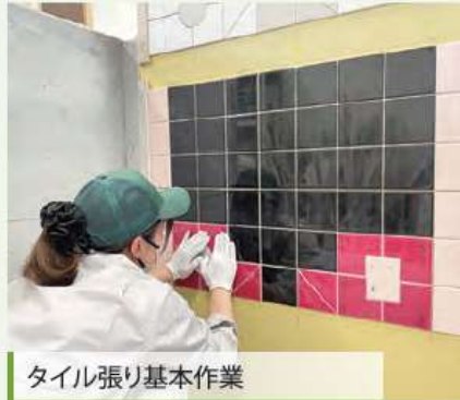
タイル張り基本作業

京壁の仕上げをしています。自然材料であり、素朴な美しさを表現したい和室によく合う材料です。