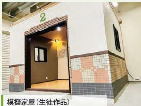
模擬家屋(生徒作品)

6畳の模擬家屋の天井クロス張りをしています。基本訓練で学んだ事を活かして皆で協力をして施工しています。