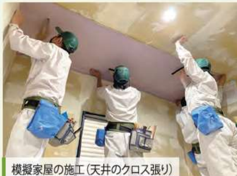
模擬家屋の施工(天井のクロス張り)

天井のクロス張りをしています。壁のクロス張りとは違い、重力によりクロスが剥がれてきやすいため、手際よく仕上げていく事が重要です。