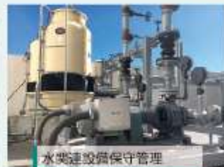
水関連設備保守管理