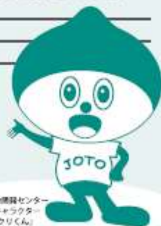
埼玉県立総合センター イメージキャラクター 「ものづくりくん」