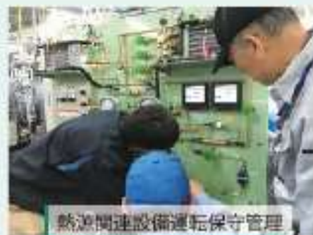
熱源関連設備運転保守管理