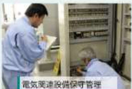
電気関連設備保守管理