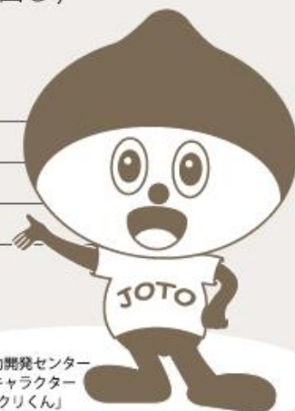
城東職業能力開発センター イメージキャラクター 「ものづくりくん」