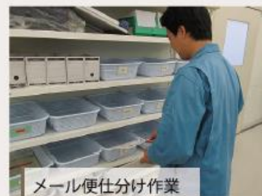
メール便仕分け作業