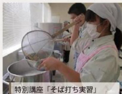
特別講座「そば打ち実習」