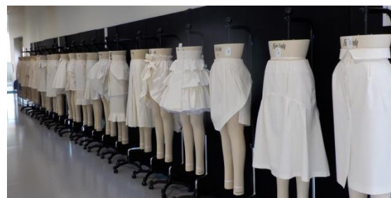
(生徒作品 アパレルパタンナー科)