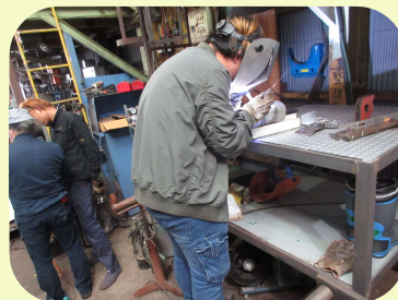
溶接スキルアップ