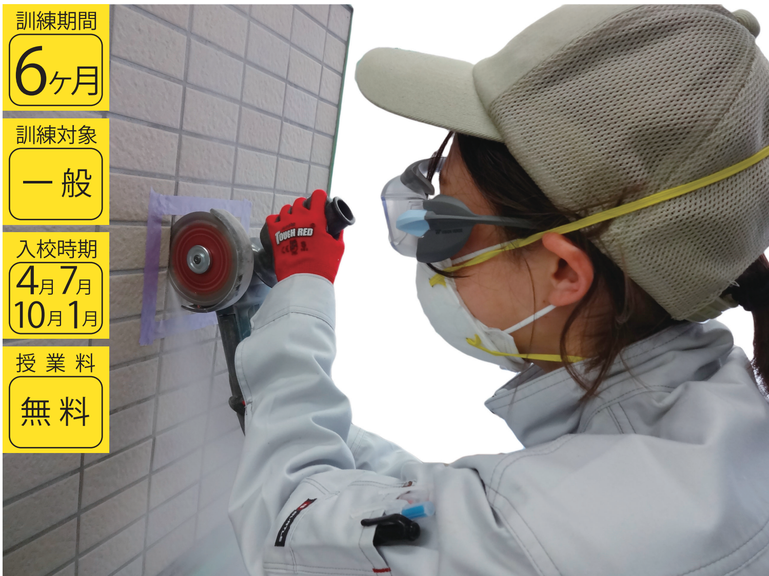
写真：外装タイル撤去作業（外壁の目地にグラインダーで切り込みを入れてタイルの撤去作業をしています。）