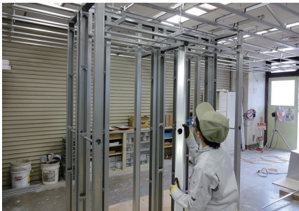
写真①：鋼製下地（壁と天井の下地）