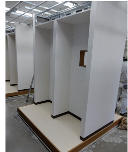
写真⑥：模擬家屋の施工（基礎）