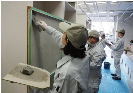
写真⑦：左官・タイル張り