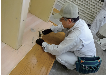
写真⑤：フローリング施工