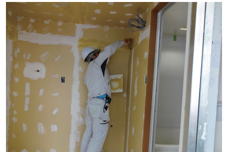
写真③：壁の下地処理（パテ処理）