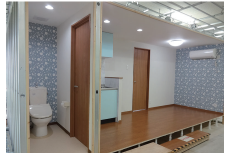
写真⑨：模擬家屋の施工（応用実習）