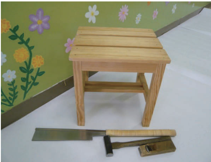
腰掛(こしかけ)イメージ