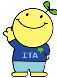
板橋校マスコット 「いたちゃん」