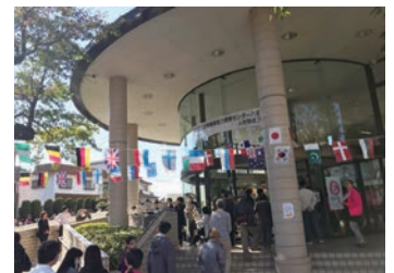
▲技能祭（11月3日）の様子