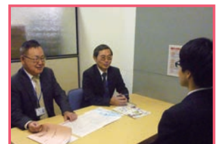
▼模擬面接 (就職支援の一環)