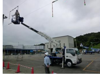
高所作業車運転 技能講習