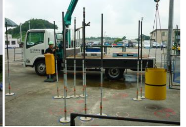
小型移動式クレーン 運転技能講習