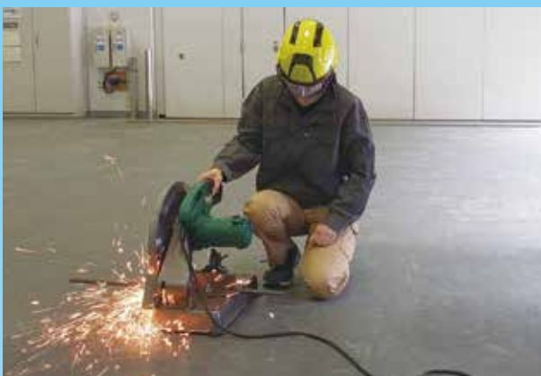
自由研削用といし特別教育