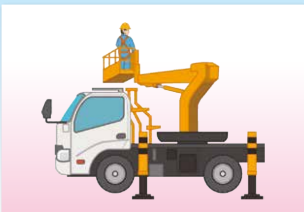
高所作業車運転技能講習