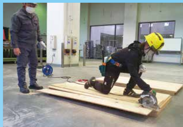
丸のこ等取扱い作業安全衛生教育