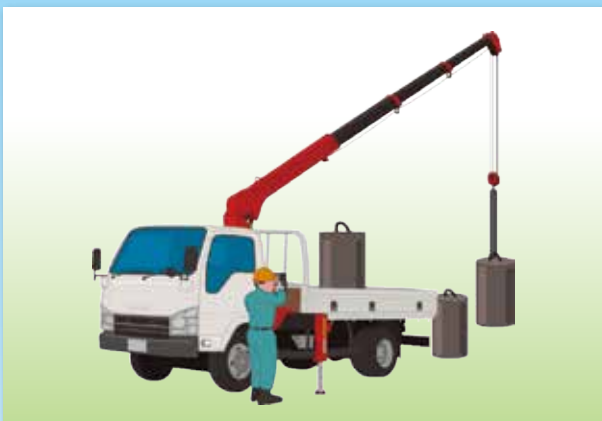
小型移動式クレーン運転技能講習