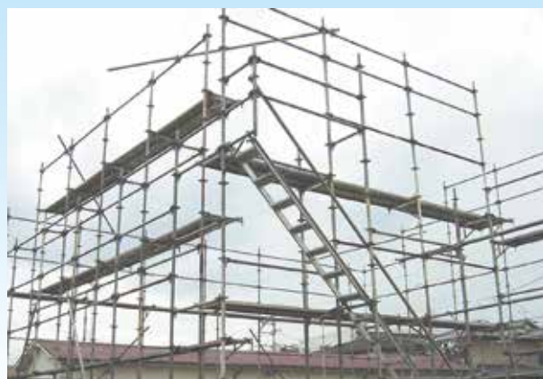
足場の組立て等特別教育(実技は行いません)