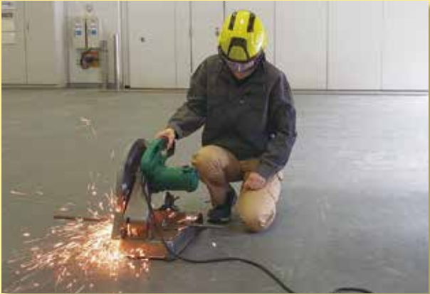
自由研削用といし特別教育