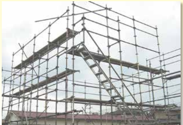
足場の組立て等特別教育(実技は行いません)