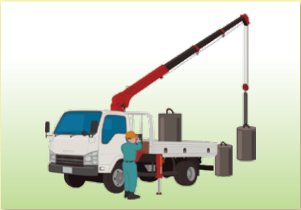
小型移動式クレーン運転技能講習