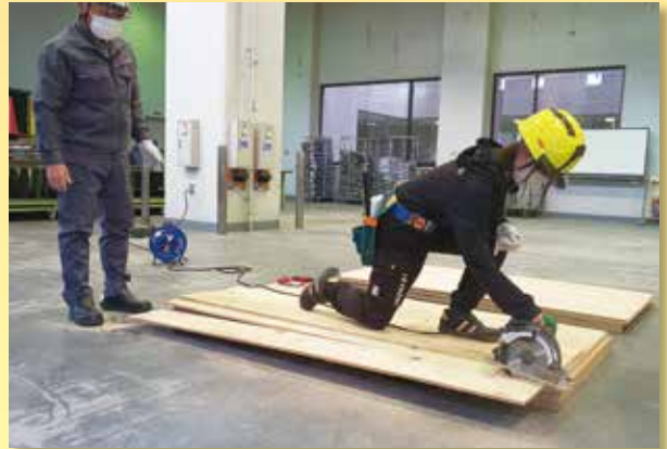
丸のこ等取扱い作業安全衛生教育