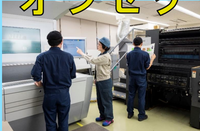
オフセット印刷機の操作を学ぶ