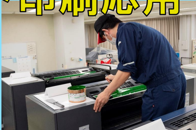
印刷機の上から「インキ壺」にインキを入れる