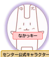
センター公式キャラクター

*自然災害その他のやむをえない事情が発生、またはその発生のおそれがあるときは講習の中止・変更を行う場合がございます。 必ずお手続きの前に、当センターにお問い合わせください。