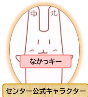
センター公式キャラクター

https://www.hataraku.metro.tokyo.lg.jp/jinzai/ikusei/carr_up_kigyou/