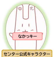
センター公式キャラクター