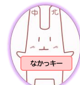
センター公式キャラクター

*自然災害その他のやむをえない事情が発生、またはその発生のおそれがあるときは講習の中止・変更を行う場合がございます。必ずお手続きの前に、当センターにお問い合わせください。