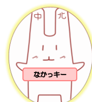
センター公式キャラクター