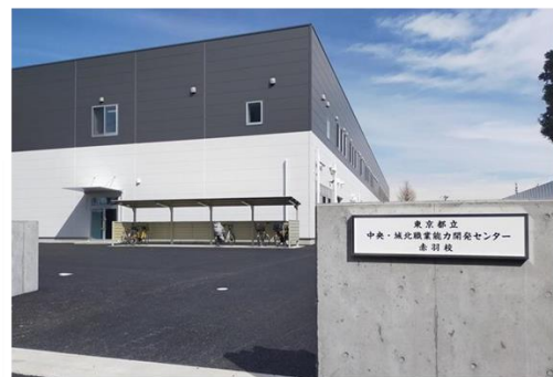
東京都立 中央・城北職業能力開発センター 赤羽校

Tokyo Metropolitan Vocational Skills Development Center