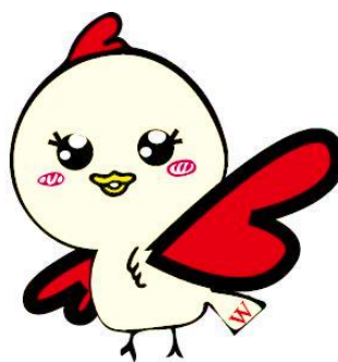
赤羽校イメージキャラクター:あかばねちゃん