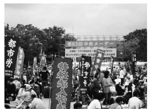
代々木公園での 全労連系メーデー

第83回三多摩メーデー実行委員会が主催する「第83回三多摩メーデー」も井の頭公園で開催されました。