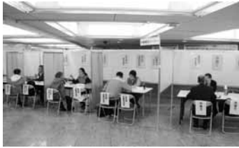
◀相談コーナーでは相談員が様々な相談に応じました。

東京都では、毎年5月と10月を「労働相談強調月間」として駅前などに臨時の相談会場を設け、街頭労働相談を実施しています。10月5日から31日にかけて、新橋・渋谷・赤羽・調布・昭島・新宿の各駅周辺と城東地域中小企業振興センターの計7か所(延べ9回)で実施しました。