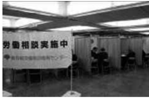
相談コーナーでは相談員が様々な相談に応じました。

東京都では、毎年5月と10月を「労働相談強調月間」として駅前などに臨時の相談会場を設け、街頭労働相談を実施しています。10月6日から27日にかけて7日間、新橋・渋谷・赤羽・昭島・仙川・新宿の各駅周辺と城東地域中小企業振興センターの計7か所で実施しました。