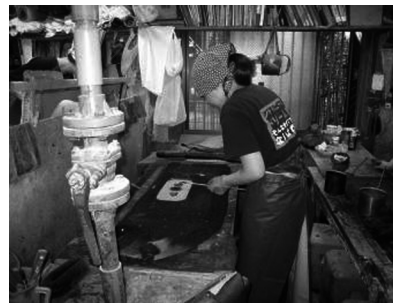
◀うまく染まるかな...? 慎重に染料を流す塾生。

職人塾での職場体験実習は20日程度。弟子入り期間後半となり、塾生は、染めた手拭から防染糊や余分な染料を水で洗い落とし、脱水機にかけ、やぐらに干して乾かすという作業を任せてもらっていました。最初の頃は覚えることが多く、失敗しないかとびくびくしていたそうですが、数ある工程の中でもたまたに体験できる“染め”の作業が、「緊張するけれど一番楽しい」と話していました。