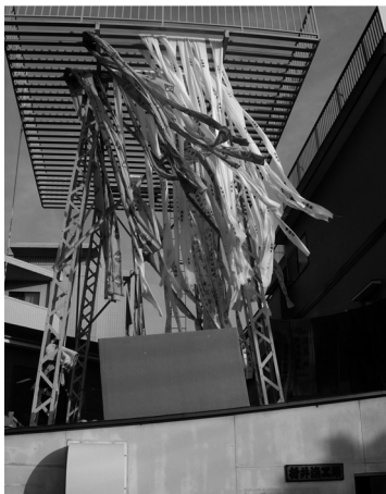
▲高さ15メートルのやぐらに登り、手拭を1枚1枚干していきます。天気の良いと1日に5～6回干すこともあります。

この事業は、若者が優れた職人技を目にし、職人の指導のもと「ものづくり」を実際に体験することで、ものづくり職種への就業の契機にするとともに、技能の継承、後継者の育成に結びつけていくことを目的としています。貴金属装身具、日本調理、造園など様々な職種で、6月下旬から随時行われています。