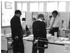
◀都内各所で街頭労働相談を実施しました。 (左の写真は渋谷駅東急百貨店東横店での様子)

期間中の来場者は約7,000人、相談は計224件あり、採用などの雇用関連や賃金不払に関する相談などが多く寄せられました。