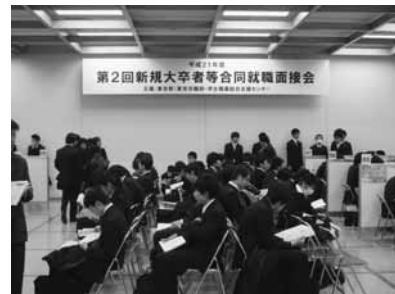
昨年度実施の様子

E-mail:roppongi@gakusei.go.jpまで送信してください。