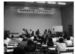
昨年のシンポジウムの様子