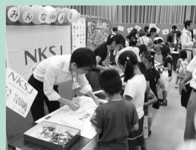
企業ファミリーデーの様子▲

この夏休みには、8月6日を中心に50を超える企業等で従業員の家族の職場訪問「ファミリーデー」が実施されました。イベントでは、ファミリーデー実施企業のブースにおいて様々な催しが行われ、親子で楽しむ姿が見られました。