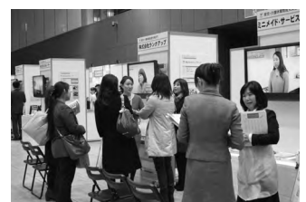
▲認定企業出展ブース