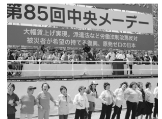
▲晴天に恵まれた全労連系メーデー

せ、また『戦争する国づくり』への道をストップさせよう」と呼び掛けました。連帯あいさつ、各団体の決意表明後、スローガン及びメーデー宣言が提案・採択されました。その後、恵比寿、明治公園、新宿の3コースに分かれデモ行進が行われました。第85回三多摩メーデー実行委員会が主催する「第85回三多摩メーデー」も井の頭公園で開催されました。