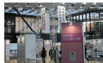
家庭と仕事の両立支援コーナー

「ライフ・ワーク・バランスEXPO東京2025」の様子は、3月7日(金)までオンライン展示会でご覧になれます。