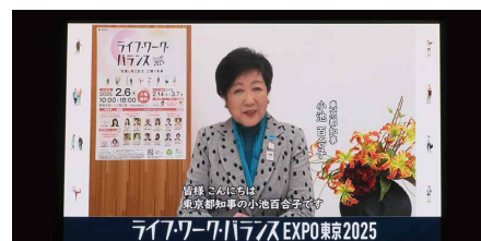
小池都知事のビデオメッセージ