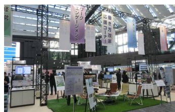
働き方改革応援コーナー