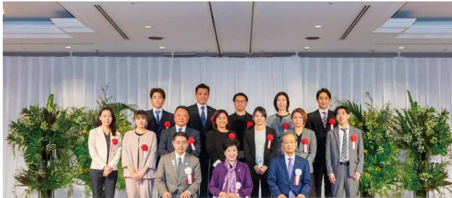
TokyoTokyo ソーシャルファームフォーラム

令和7年1月、新たに1つの認証事業所と18の予備認証事業所を決定しました。また、企業のソーシャルファーム創設への意欲を喚起し、広く都民のソーシャルファームに対する理解の向上を図るイベント、「TokyoTokyoソーシャルファームフォーラム」を1月27日(月)に開催しました。