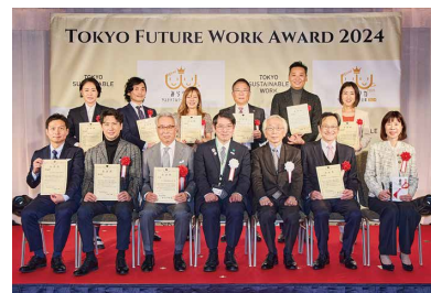
受賞企業(10社)での記念撮影