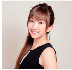
▲ゲスト 山田 まりや さん

育児と仕事の両立や復職時の不安の解決方法等をどのように解決したかについて、子育て中のタレントが、キャリアコンサルタントを交え、等身大で語ります！