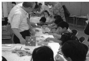
▲昨年度の体験教室の様子

熟練職人による実演、作品展示、体験教室の開催や技能五輪全国大会等の紹介を行います。また、ロボットなどによるIT体験もできます。この機会にぜひ、様々な匠の技に触れてみませんか!