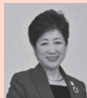
▲東京都知事 小池 百合子