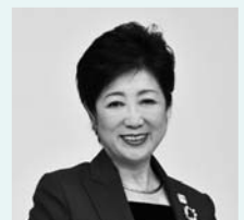
▲主催者挨拶及び授与者 東京都知事 小池 百合子