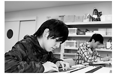
▲ジョブセレクト科

〔選考日〕①③6月3日(金)、②6月16日(木) 〔申込み〕①③5月24日(火)までにハローワークか各職業能力開発センターへ。②5月15日(日)～6月14日(火)に城東職業能力開発センターへ。