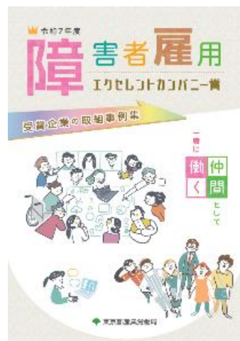
【令和7年度 取組事例集】

【メリット2】各種イベントでの紹介などPRの機会が増えます。 ⇒イベントを通じ、他企業との交流や、顧客獲得の機会に！ 都が実施する普及啓発事業(イベント等)で自社の取組や事業を広報できます！