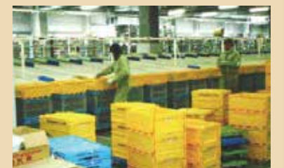
物流・サービスコース