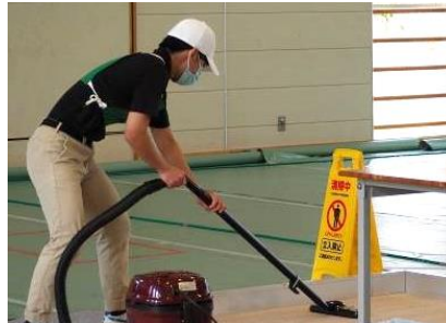
ビルクリーニング