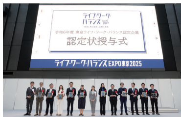
認定状授与式での表彰