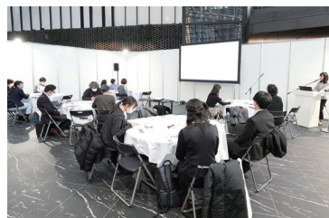
認定企業交流会への登壇