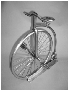
銅賞受賞作品 「クラシック・サイクル」

講評では、「技術水準が高い」「即戦力として期待できる」など、生徒の技術・技能が高く評価されました。