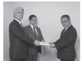
東京労働局長と都産業労働局長が要請文を手渡しました。

また、東京労働局においては、ハローワークによる特別求人開拓や就職面接会等を積極的に行います。