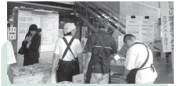
パンの販売は今年も大好評でした。