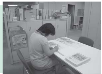
資料準備作業中。作業は丁寧かつ手早く、てきぱきと行っています。