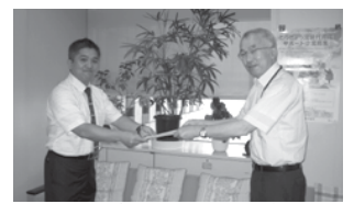
「TALANT」の代表者に小田雇用就業部長から指定書が手渡されました。