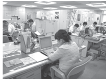
パソコン入力業務中。作業はとても正確です。スムーズに業務をこなしています。

この成果を都内区市町村や企業に広く情報提供することで、障害者の雇用・就業の推進につなげていきます。