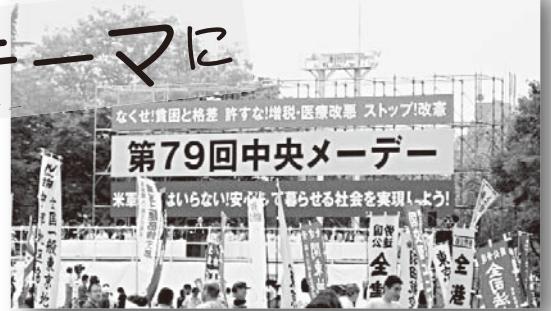
晴天のもと開催された全労連系メーデー