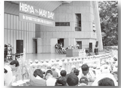
日比谷公園での全労協系メーデー